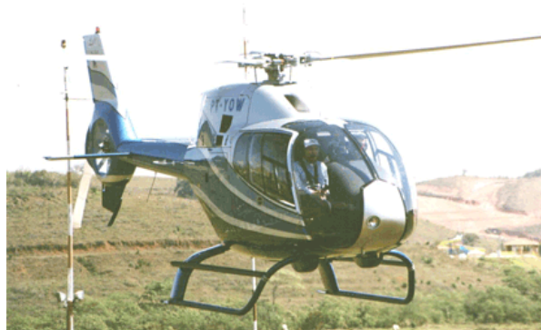
EC 120 - Colibri

É por isto que um dos nossos valores é, exatamente, "gostamos do que fazemos".