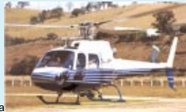
AS - 350 B2